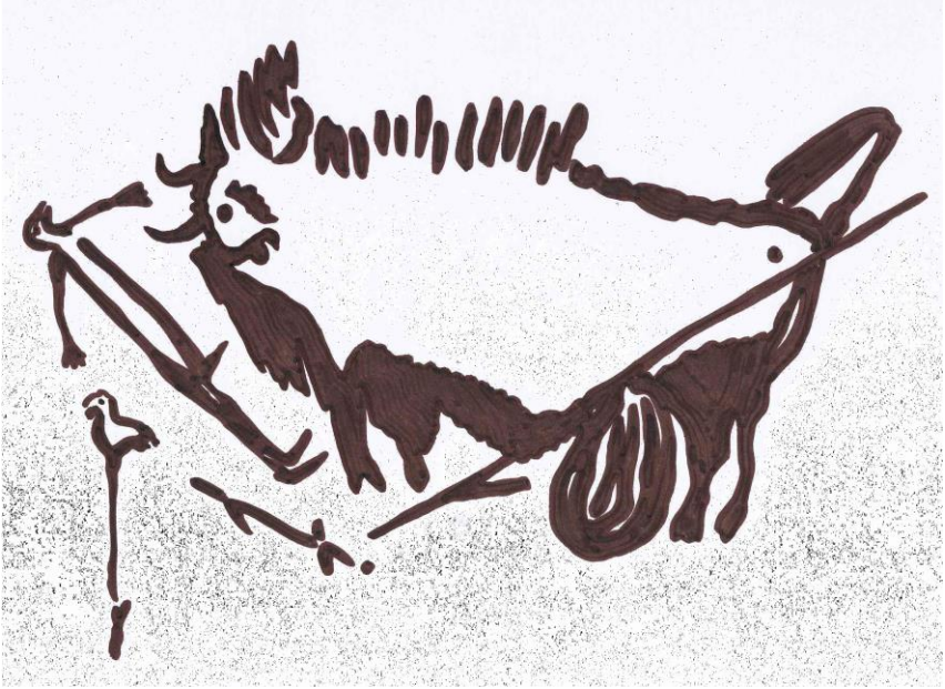
Il Pozzo nelle Grotte di Lascaux (Francia)